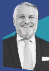
汤玛斯·吉斯特教授 宝马集团 全球文化事务总监