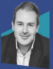
Darren Thayre教授 Google 全球战略规划创新主管