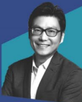
董本洪 阿里巴巴集团 首席市场官