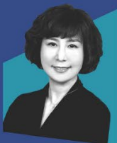
金昱冬 Visa 亚太区高级副总裁兼 市场营销主管