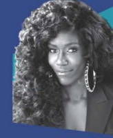
Bozoma Saint John Endeavor 首席营销官 (2018-2020) Uber 首席品牌官 (2017-2018) iTunes 及 Apple Music 环球消费市场总监 (2014-2017)