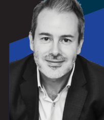
Darren Thayre 教授 Google 全球战略计划创新主管