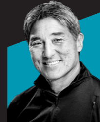
盖伊·川崎先生 Canva 首席宣传官 梅赛德斯奔驰 品牌大使 (2015 - 2020) 苹果 首席宣传官 (2017 - 2018)