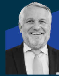
托马斯·吉斯特教授 宝马集团 全球文化事务总监