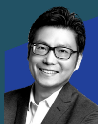
董本洪 阿里巴巴集团 首席市场官